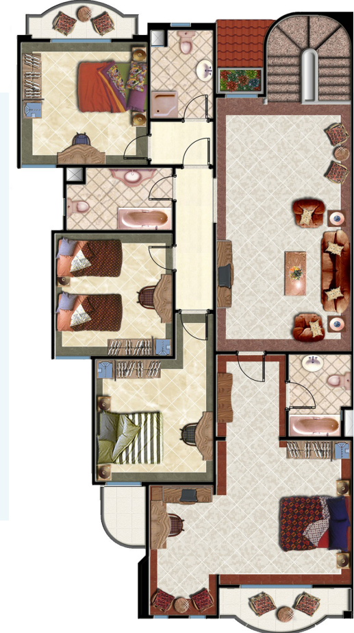
First Floor الدور الأول