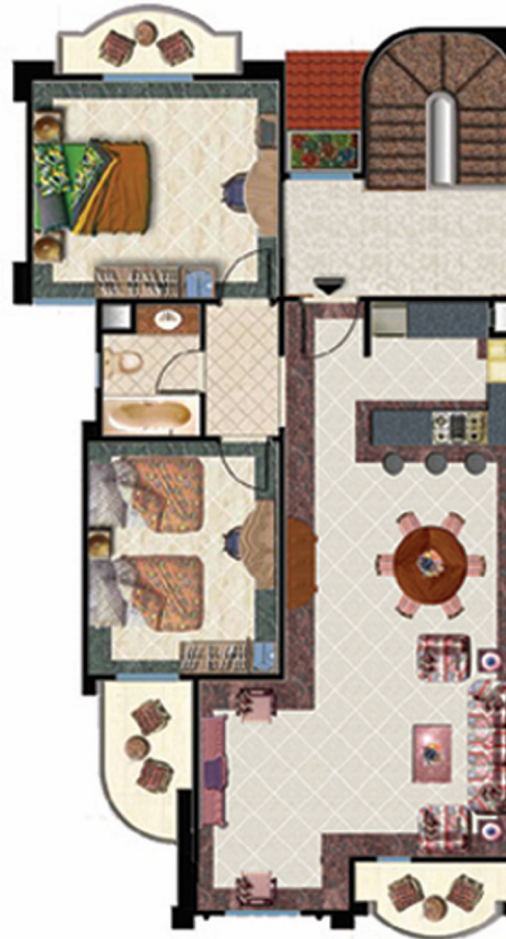
Ground Floor الدور الارضي