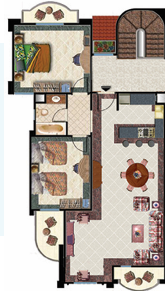
First Floor الدور الأول