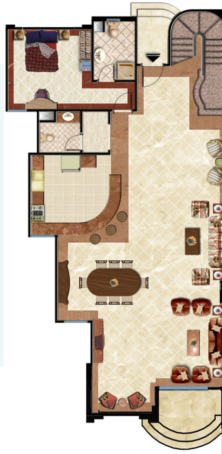
Ground Floor الدور الارضي